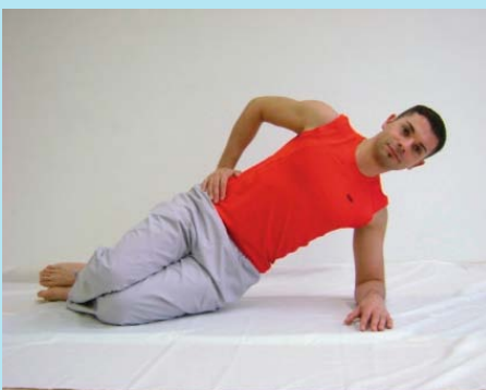
Reha-Phase I Basic

Mit einfachen Übungen die Beweglichkeit erlernen und vor allem den Rumpf stärken, die Bewegungsqualität für den Alltag fördern.