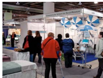
Der SVBM an den Gesundheitstagen 2009 in Bern...