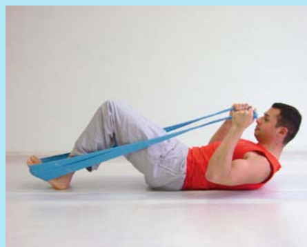
Reha-Phase II Kräftigung obere und untere Extremitäten

Mit einfachen Übungen die Beweglichkeit erlernen und vor allem den Rumpf stärken, die Bewegungsqualität für den Alltag fördern.