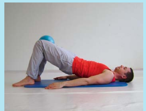
Reha-Phase III Schulung Sensomotorik mit Kleinball «Overball»

Vor allem das Theraband kann einerseits die Übungen erleichtern oder auch erschweren. Die Bewegungen können noch langsamer, harmonischer, kontrollierter und gelenkschonender mittels des Therabands ausgeführt werden. Es fördert die Bewegungsqualität. Überdies kann das Theraband gezielter die tiefe Muskulatur ansteuern.