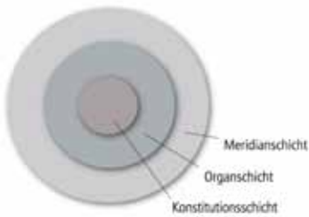
Abb. 1: Drei-Schichten-Modell der APM nach Radloff

Die Ohr-Reflexzonen-Kontrolle (ORK) spielt dabei eine zentrale Rolle. So wird es durch diese Befunderhebungstechnik möglich, den energetischen Zustand des Schmerzes zu eruieren. Das bedeutet, dass daraus hervorgeht, ob es sich dabei um einen Fülle- oder einen Leereschmerz handelt. Denn es ist durchaus möglich, dass vergleichbare Symptome aufgrund einer Fülle oder einer Leere entstehen. So kann beispielsweise die Kälteanwendung bei Schmerzen nicht generell empfohlen werden. Je nach energetischem Zustand erfordert die Linderung Kälte oder Wärme! Die Diagnosefindung in der APM nach Radloff basiert nicht auf der Interpretation von Symptomen, sondern auf der Interpretation und dem Ausgleich von Yin und Yang.